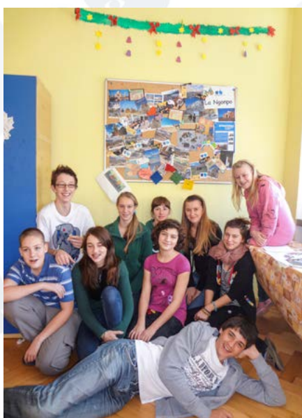
ZŠ NOVÝ RYCHNOV