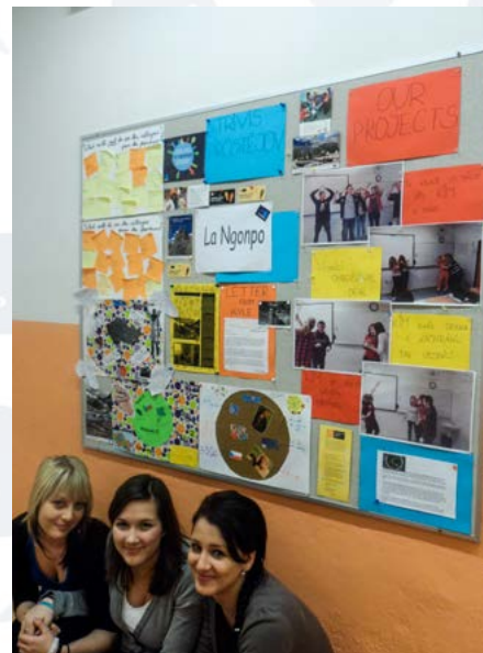
SŠV TRIVIS, PROSTĚJOV

Některé třídy se před Vánoce mohly radovat z nadílky La Ngonpo triček pro celou třídu. Byly to třídy, které se zúčastnily soutěže vypsané Multikulturním centrem Praha o nejhezčí nástěnku La Ngonpo. Fotografii se nám sešla celá řada a bylo opravdu těžké vybrat tu nejhezčí nástěnku, a proto jsme se rozhodli odměnit více škol v různých kategoriích. Z triček se tak mohou radovat na ZŠ v Pečkách, Sedlčanech či na SŠV TRIVIS v Prostějově. Po deseti tričkách za aktivní přístup jsme se rozhodli poslat i do ZŠ Jablonné nad Orlicí a ZŠ Nový Rychnov. Podívejte se, jak jim sluší!