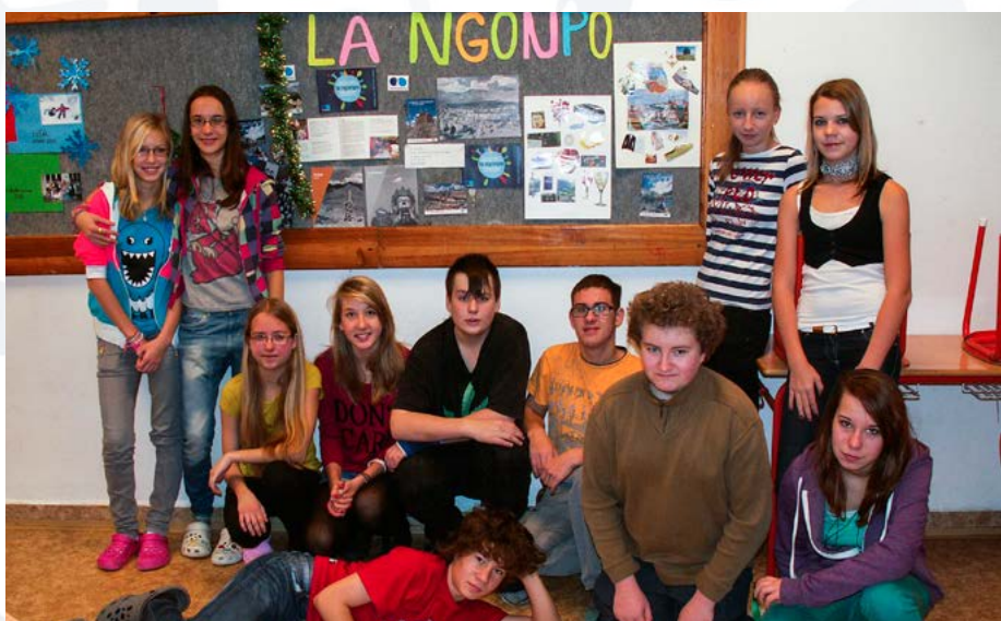
ZŠ GENERÁLA FRANTIŠKA FAJTLA, PRAHA